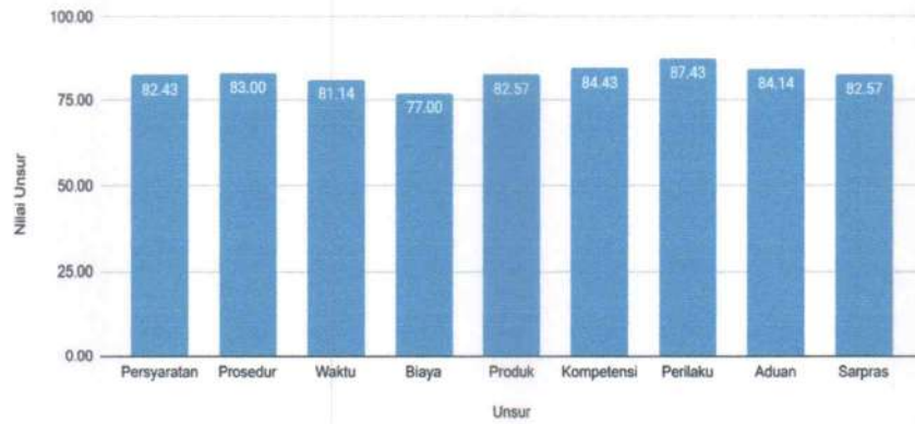
Nilai Unsur vs Unsur