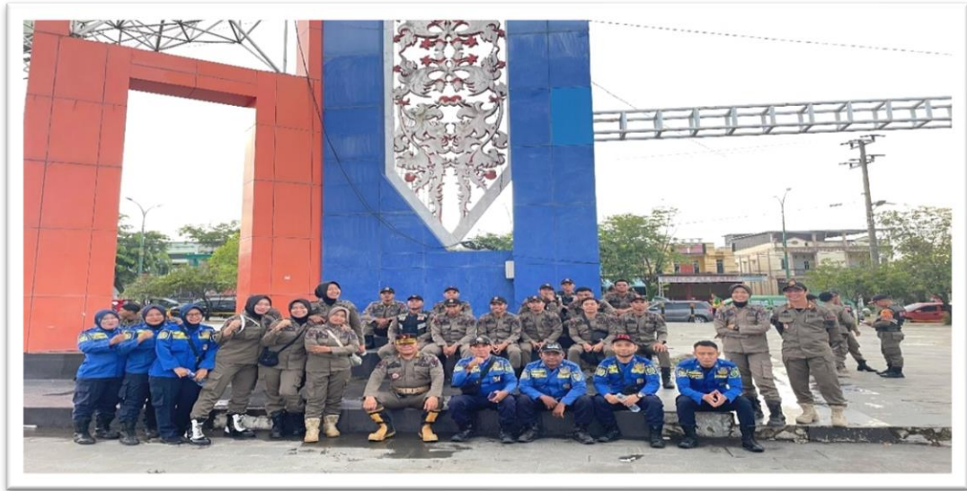
Foto 3.2.1 Sinergitas Lintas Fungsi Oprasi Pekat