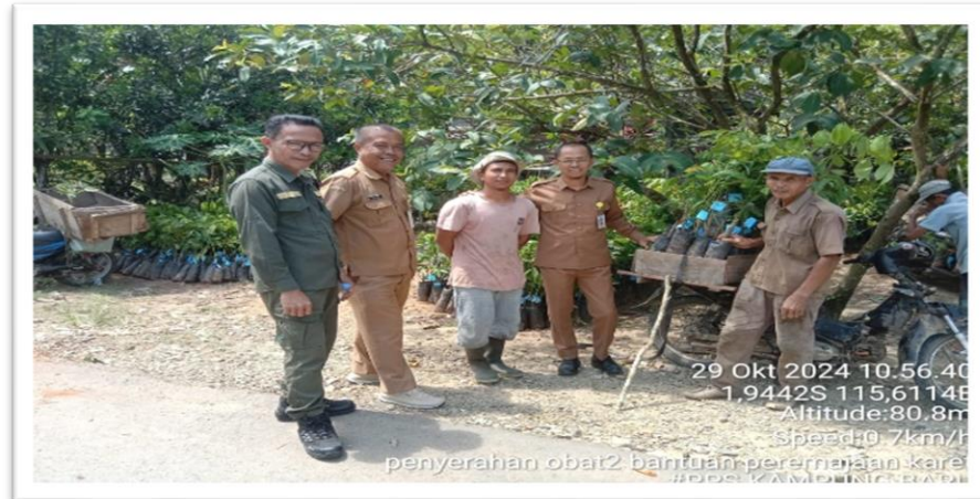
Foto 3.2.2 Bantuan Alat Pertanian

terhadap PDRB tahun 2024 dengan capaian realisasi sebesar 7,61 persen dengan capaian kinerja sebesar 49,77 skala nilai Sangat Rendah.