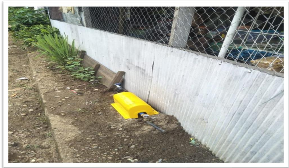
Foto 3.2.5 Pemasangan Air Bersih Analisis Persentase Penduduk Berakses Air Minum