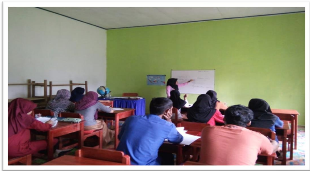
Foto 3.2.6 Kegiatan Belajar Paket

Pembangunan Manusia pada tahun 2024 mencapai target. Realisasi Indikator Kinerja Indeks Pembangunan Manusia sebesar 75,97 Realisasi Capaian sebesar 101,19 persen dapat dikategorikan dengan skala nilai kinerja Sangat Tinggi .