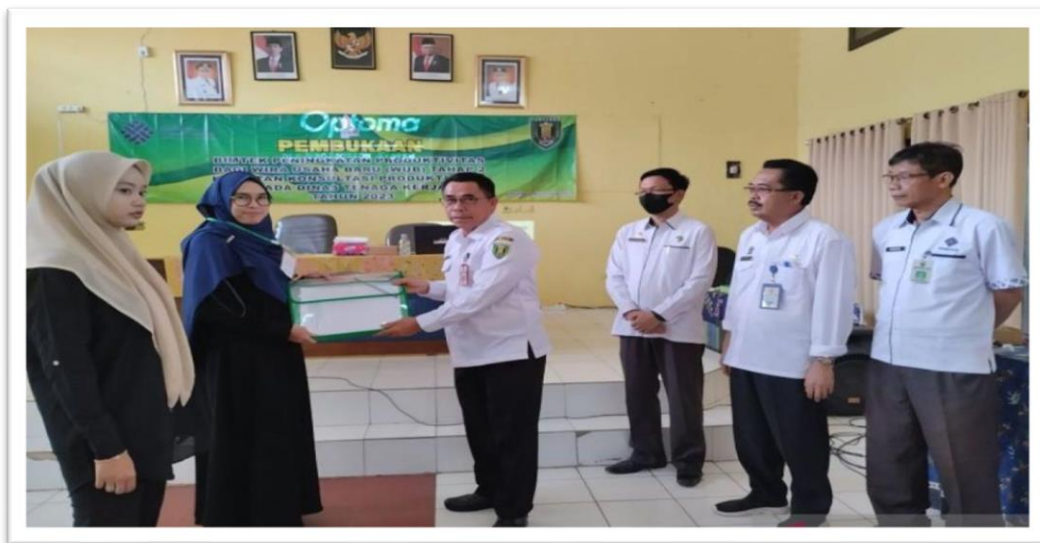
Foto 3.2.7 Kegiatan Bimbingan Wira Usaha

Dari tabel di atas dapat diketahui bahwa indikator kinerja dari sasaran “Meningkatnya Kesempatan Kerja Terutama Bagi Penduduk Lokal” yaitu Tingkat Pengangguran Terbuka berhasil melebihi target yang ditetapkan. Realisasi capaian indikator kinerja Tingkat Pengangguran Terbuka sebesar 3,44 persen. Realisasi capaian indikator kinerja ini pada tahun 2024 dikategorikan dengan skala nilai perangkat kinerja Sangat Tinggi.