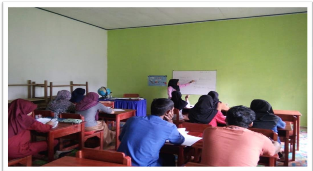
Foto 3.2.6 Kegiatan Belajar Paket

sebesar 9,15, dan Harapan Lama Sekolah sebesar 12,92. Sedangkan Realisasi Capaian yaitu indikator kinerja Angka Harapan Hidup sebesar 105,69 persen, Rata-Rata Lama Sekolah sebesar 92,14 persen, dan Harapan Lama Sekolah sebesar 89,34 persen. Realisasi capaian satu indikator kinerja Tinggi dan dua indikator kinerja pada tahun 2024 dikategorikan dengan skala nilai perangkat kinerja Sangat Tinggi .