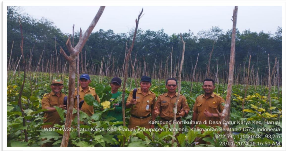
Foto 3.2.4 Kampung Hortikultura di Desa Catur Karya

kinerja tersebut sebesar 85,94 persen dikategorikan dengan skala nilai perangkat kinerja Sangat Tinggi .