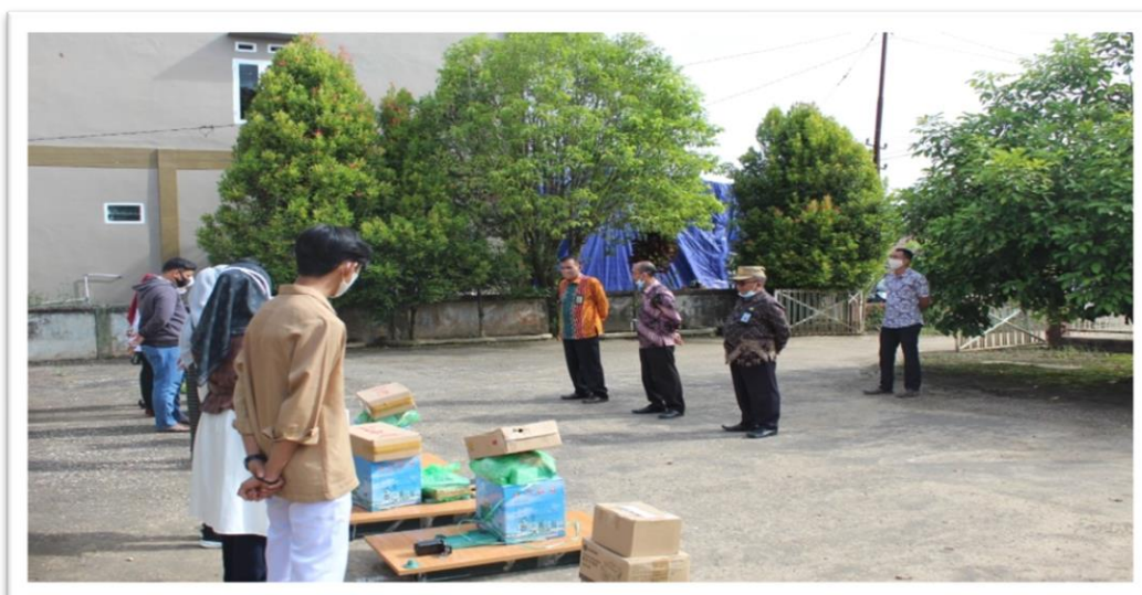
Foto 3.2.9 Kegiatan Pemberian Paket Usaha Dan Bantuan Bahan Pokok

Dari tabel di atas dapat diketahui bahwa indikator kinerja dari sasaran Menurunnya Tingkat Kemiskinan yaitu indikator kinerja Persentase Penduduk Miskin tidak mencapai target. Realisasi capaian realisasi indikator kinerja Menurunnya Tingkat Kemiskinan sebesar 5,64 persen realisasi capaian indikator kinerja ini pada tahun 2024 dikategorikan dengan skala nilai perangkat kinerja Sangat Tinggi .