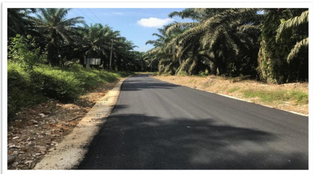
Foto 3.2.3 Jalan Desa dan Jalan Kabupaten

Dari tabel di atas dapat diketahui bahwa 2 (dua) indikator kinerja dari sasaran Meningkatnya Akses Mobilitas dan Kualitas Jalan yang Menghubungkan seluruh Wilayah Kabupaten yaitu indikator kinerja Persentase desa yang bisa di akses dengan mudah, dan indikator kinerja Persentase jalan kabupaten dalam kondisi mantap, pada tahun 2024 telah mencapai target. Capaian realisasi kedua indikator kinerja ini dikategorikan dengan skala nilai perangkat kinerja Sangat Tinggi .